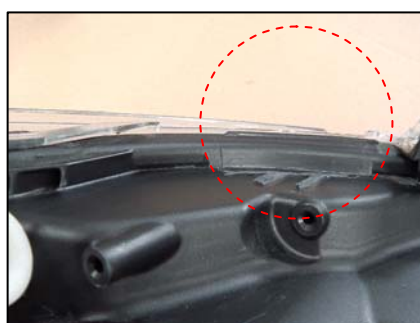
リテーナ取り付け部切断