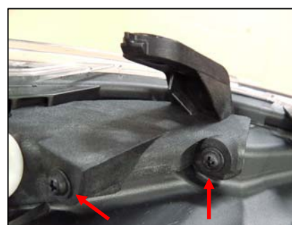
リテーナ取り付け