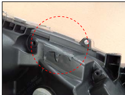
リテーナ取り付け部切断