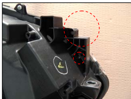
ブラケット取り付け部切断