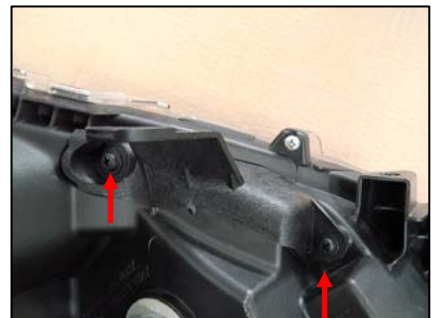
リテーナ取り付け