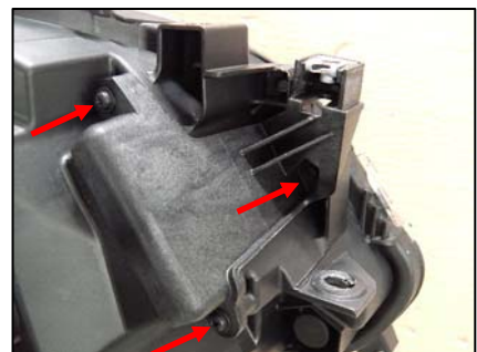
ブラケット取り付け