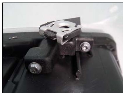
リペアキット取り付け