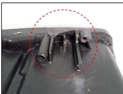
リペアキット取り付け部切断