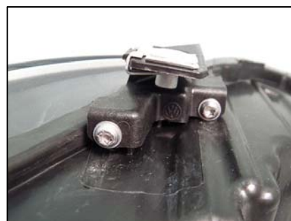
リペアキット取り付け