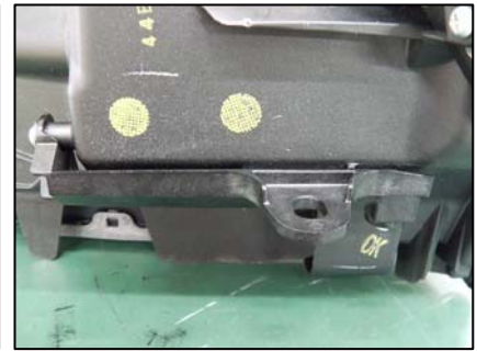
リテーナ取り付け