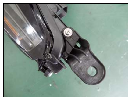
リテーナ取り付け