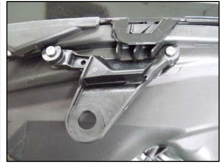
リテーナ取り付け