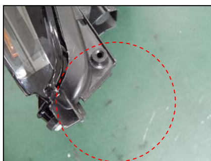
リテーナ取り付け部切断