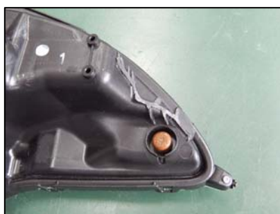
ブラケット取り付け部切断