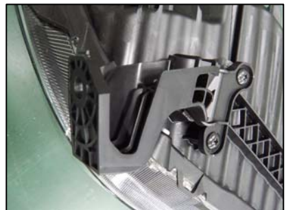
ブラケット取り付け