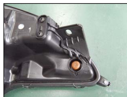
ブラケット取り付け