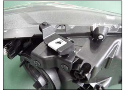
ブラケット取り付け