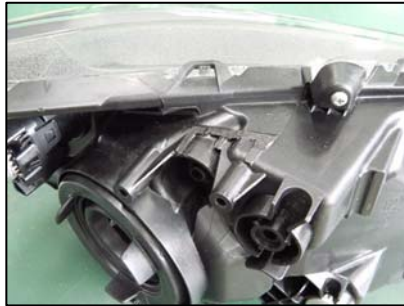
ブラケット取り付け部切断