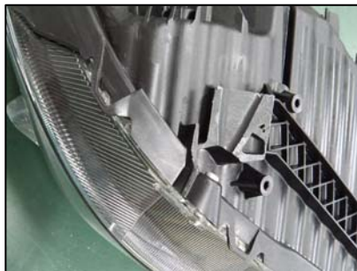
ブラケット取り付け部切断